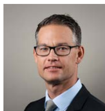
Patrick Erne Leiter Research

Alternative Strategien, welche weniger mit den Zins- und Aktienmärkten korreliert sind, bieten für die nächsten Monate nicht nur attraktive Renditemöglichkeiten, sondern leisten auch einen wichtigen Beitrag zur Portfoliodiversifikation. In den 70er Jahren gab es ausser Gold kaum Alternativen zu Aktien und Anleihen. Heute stehen verschiedene alternative Anlagestrategien zur Auswahl, die ein traditionelles Portfolio gerade in Stressphasen und anhaltenden Bärenmärkten diversifizieren können. Wir empfehlen, einen Teil der Zins- und Aktienrisiken zugunsten von Alternativen Anlagen zu reduzieren. Die besten Ideen in diesem Bereich finden Sie auf Seite 6.